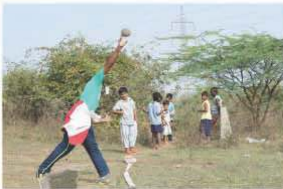
Best photograph by Sai Arun Dharmik